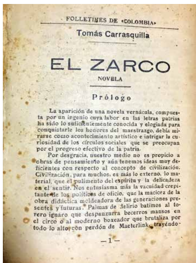
Primera página de la edición folletinesca publicada por Colombia. Diario de la Tarde de la obra El zarco , en 1925.

épocas y nacionalidades que se vanaglorian sustentados en un contacto harto superficial con la obra de Tomasito.